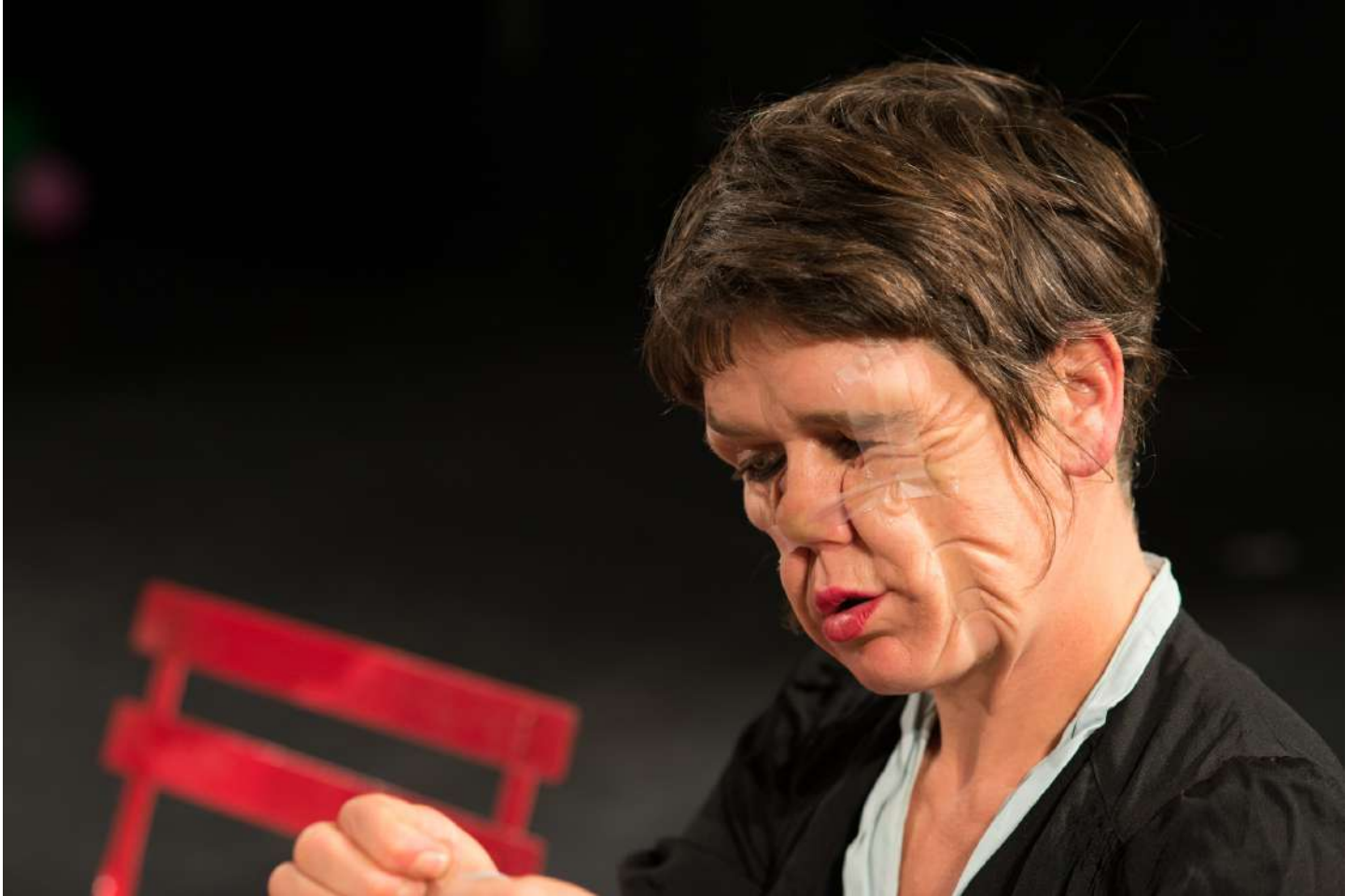
Hannah Verwimp / Déformations