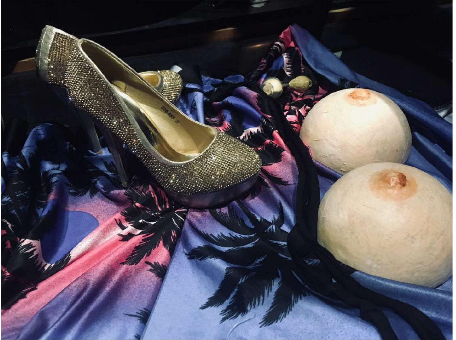
Des attributs Résidence n°2 Théâtre Durance Château Arnoux-St-Auban janvier 2020