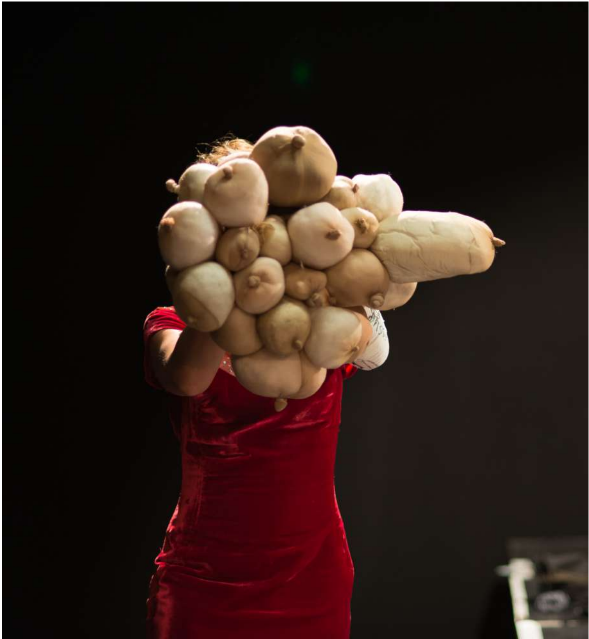
Manipulations inspirées de Nice Tits - Sarah Lucas Construction et manipulation Marine Dubois Résidence n°4 - Vélo Théâtre - Apt juin 2020